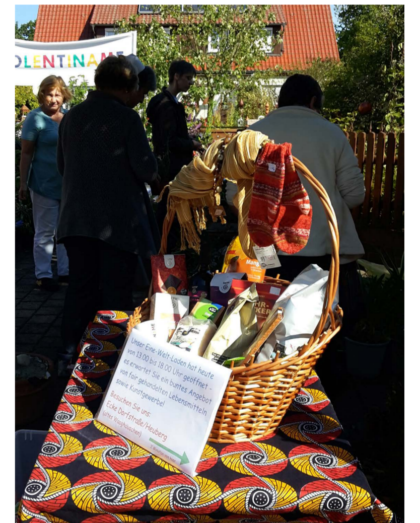
Warenkorb als Werbung für unseren Eine-Welt-Laden an der Kirchweih!

Dez. Adventsmarkt und Eine-Welt-Laden geöffnet!