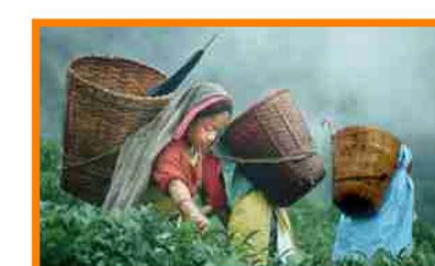
Fairtrade-Tee: Pflückerinnen auf der Teeplantage Bild homepage: fairtrade-deutschland

Solentiname Eine-Welt-Gruppe Puschendorf e.V.