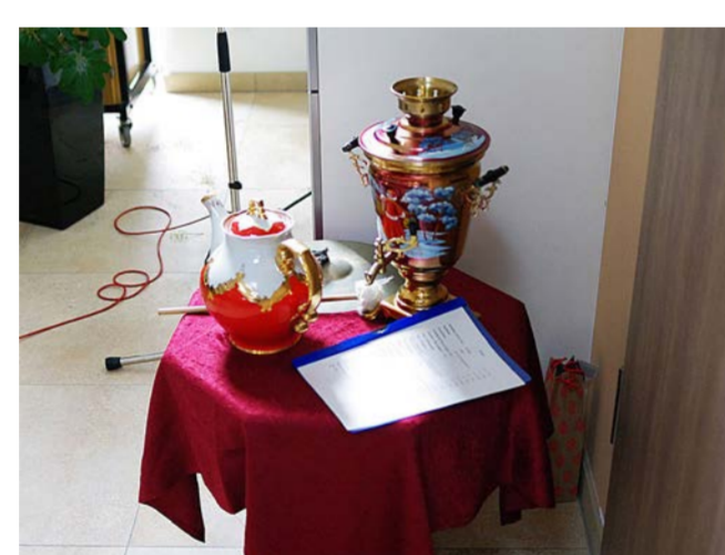
Dekoration nach Teeland