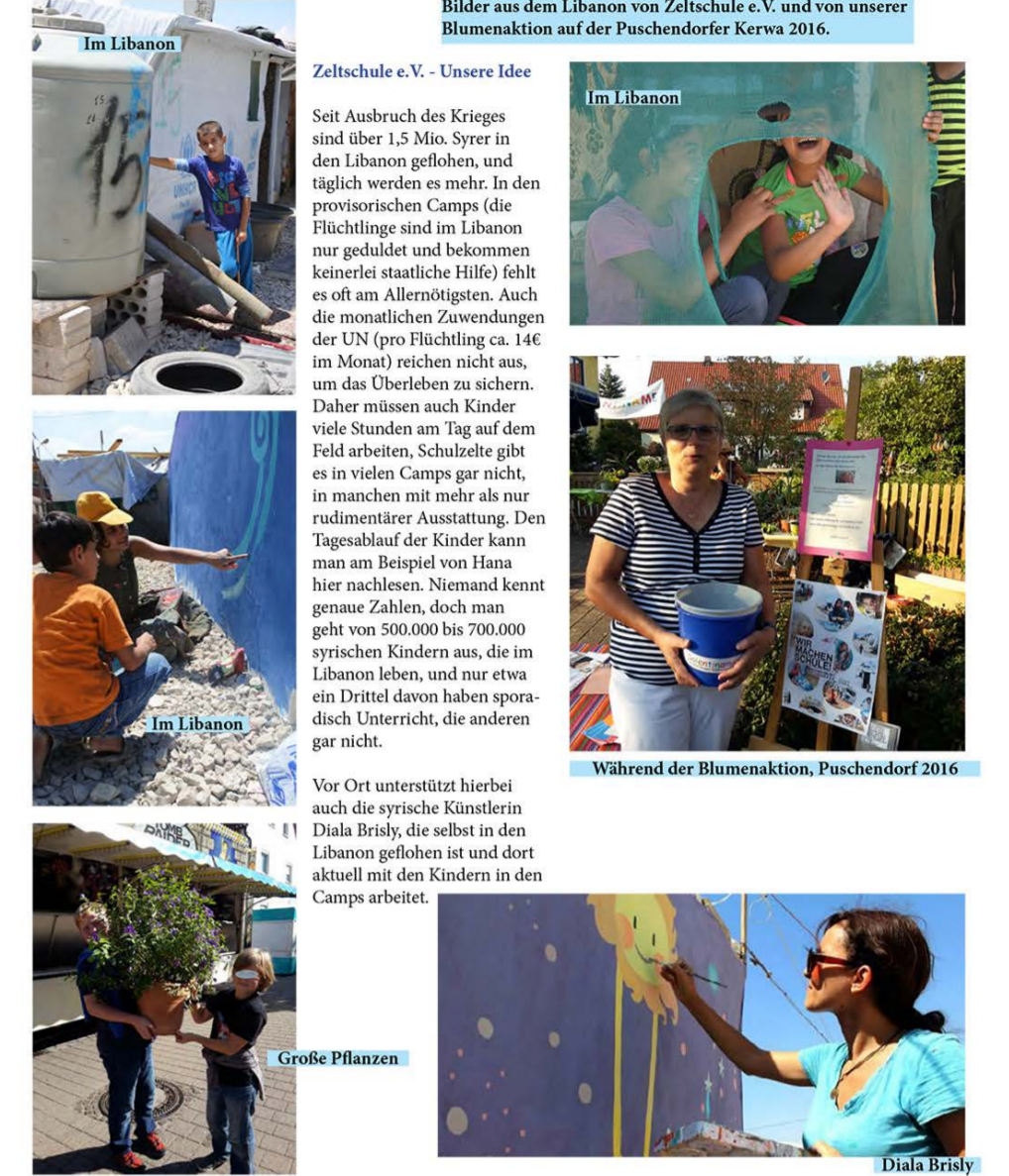
Erlös für die Zeltschule

Besuchen Sie uns im Internet unter www.solentiname-eineweltgruppe.de