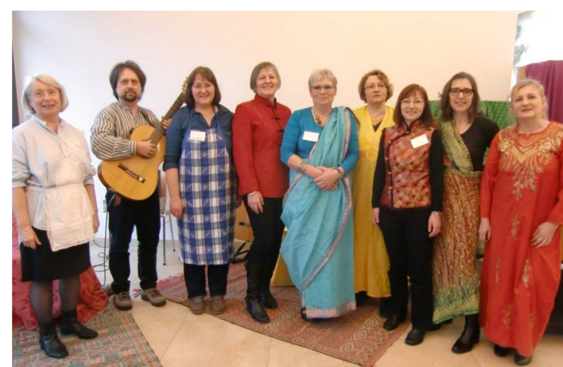
Wir servieren Tee in "Verkleidung"