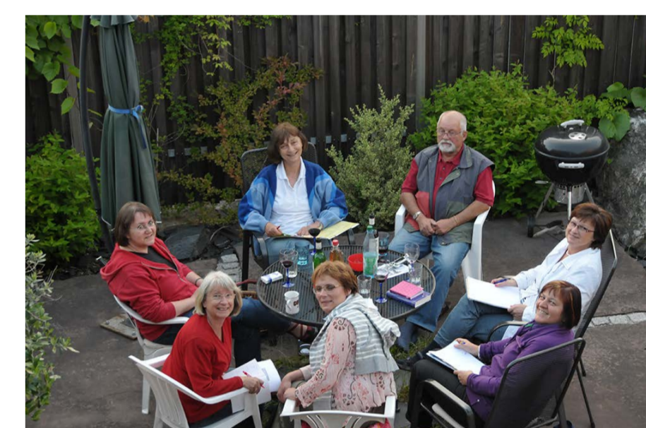
Gruppentreffen im Garten

Dez. Adventsfenster Eine-Welt-Laden "Weihnachten wie es früher war"