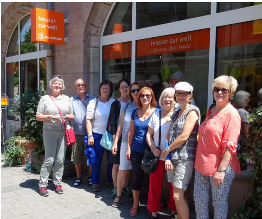
Gruppenbild vor dem "Fenster zur Welt"

Juni Informationstag "Fairspeisen ohne Gewissensbisse" "fairer" Stadtrundgang in Nürnberg