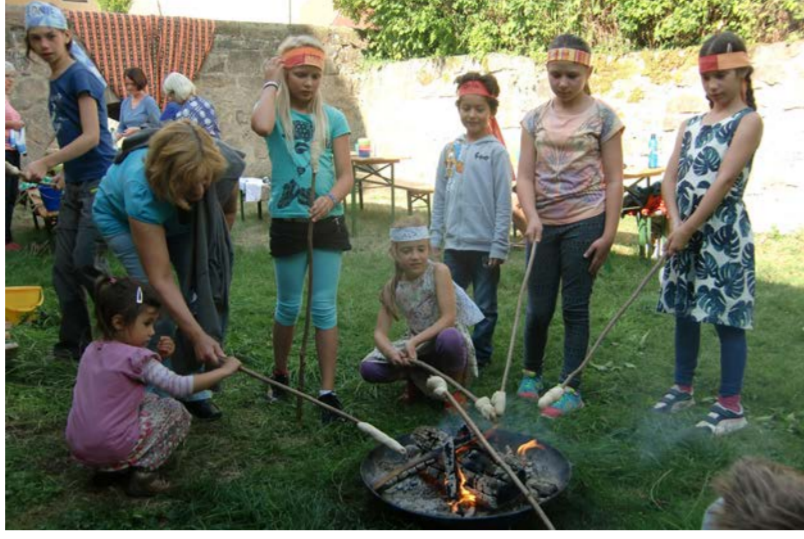
Wir kochen und spielen mit den Ferienprogramm-Kindern im Kirchgraben

2015 Sept Ferienprogramm "Kochen wie in Afrika"