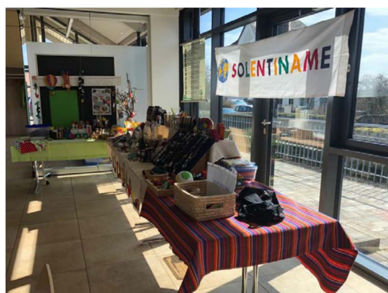
Dekoration und Verkaufstisch Ostermarkt