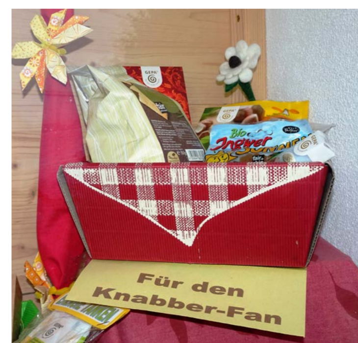
Geschenkbild-Aktion: Geschenkbild, bestückt mit Fairen Produkten aus unsrem Eine-Welt-Laden