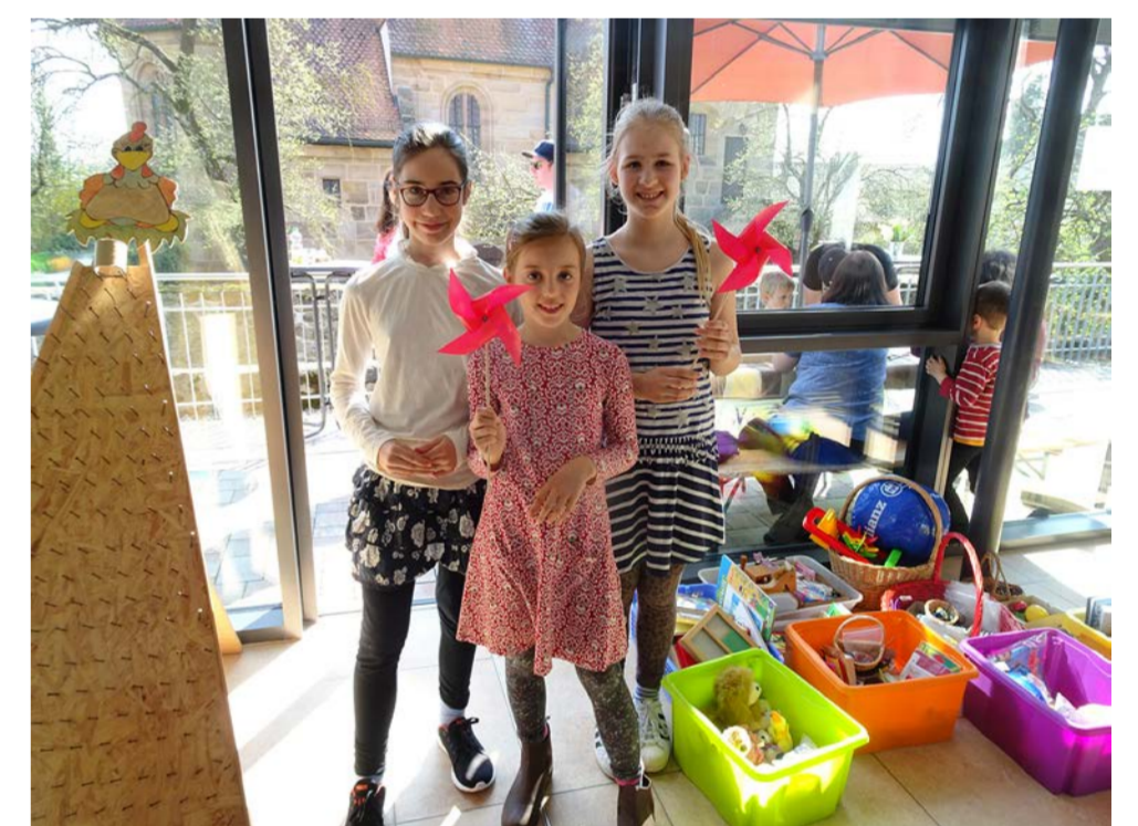
Kinder mit selbstgebastelten Windrädern