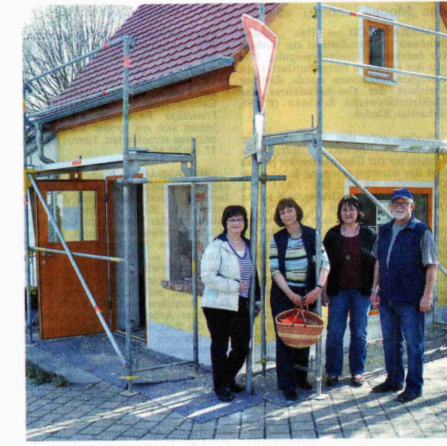
Freudige Hände haben dafür gesorgt, dass sich das Puschendorfer Waaghäuschen zum Eine-Welt-Laden wandelt.

Puschendorfer Waaghäuschen: Endspurt auf Baustelle